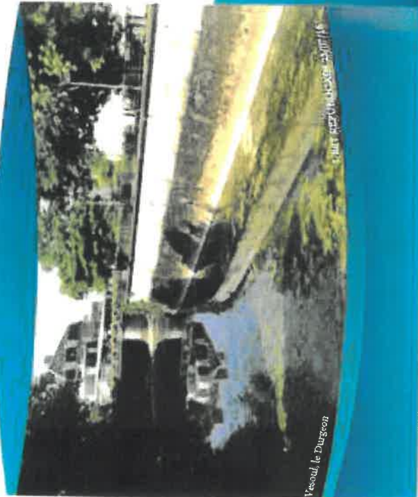
Vesoul, le Dugezon

Économiser l'eau, c'est protéger la ressource mais c'est aussi réduire ses dépenses